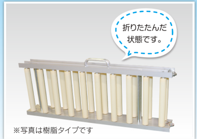
※写真は樹脂タイプです